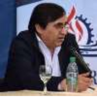
Por Rubén Daza, Secretario de economía Popular de La Provincia de Jujuy

“... Solo con la construcción de otra economía que conviva con las actividades privadas tradicionales y con el estado, vamos a poder gestionar conocimientos para fortalecer territorios solidarios que mejoren las oportunidades para todos y generen la calidad de vida de una sociedad más justa.”